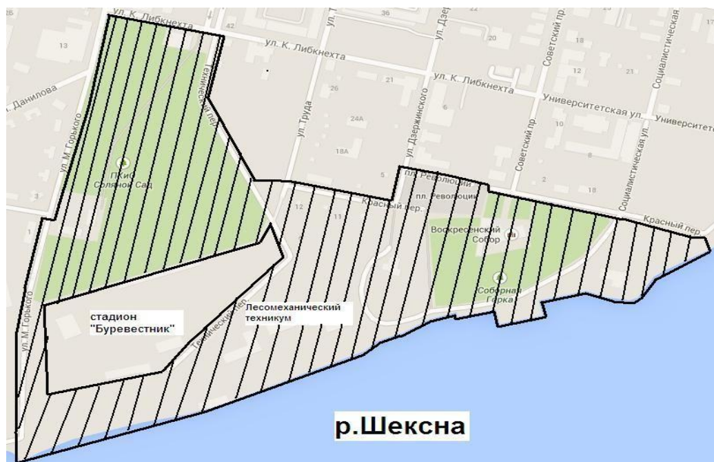
Схема мест проведения спортивного праздника в рамках Всероссийских массовых соревнований по спортивному ориентированию «Российский Азимут – 2019»